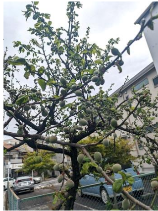
↑梅の実が、大きくなってきました。通常は、梅雨の前からなのですが。不思議です。